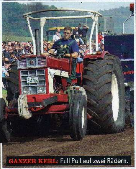
GANZER KERL: Full Pull auf zwei Rädern.