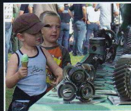
SONNTAGSSPASS: Gefangen zwischen Eis und Trophäen.