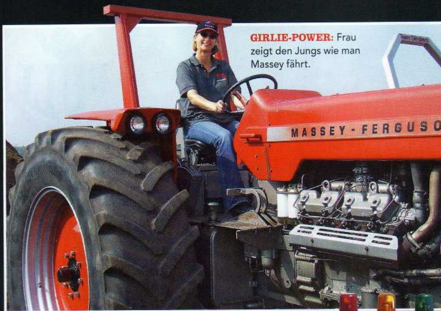
GIRLIE-POWER: Frau zeigt den Jungs wie man Massey fährt.