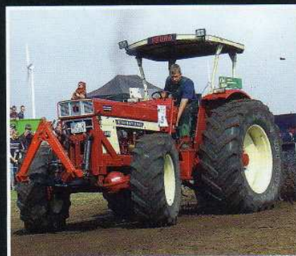
COOL BLEIBEN: Vor dem Start ist nach dem Start.